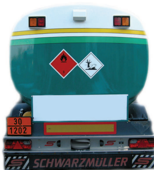
Abb. 2) Anbringen der Kennzeichnung auf kontrastierendem Hintergrund.