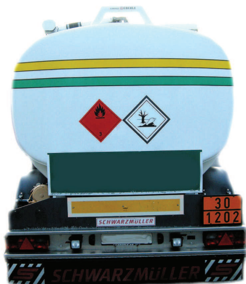
Abb. 1) Anbringen der Kennzeichnung auf nicht kontrastierendem Hintergrund.